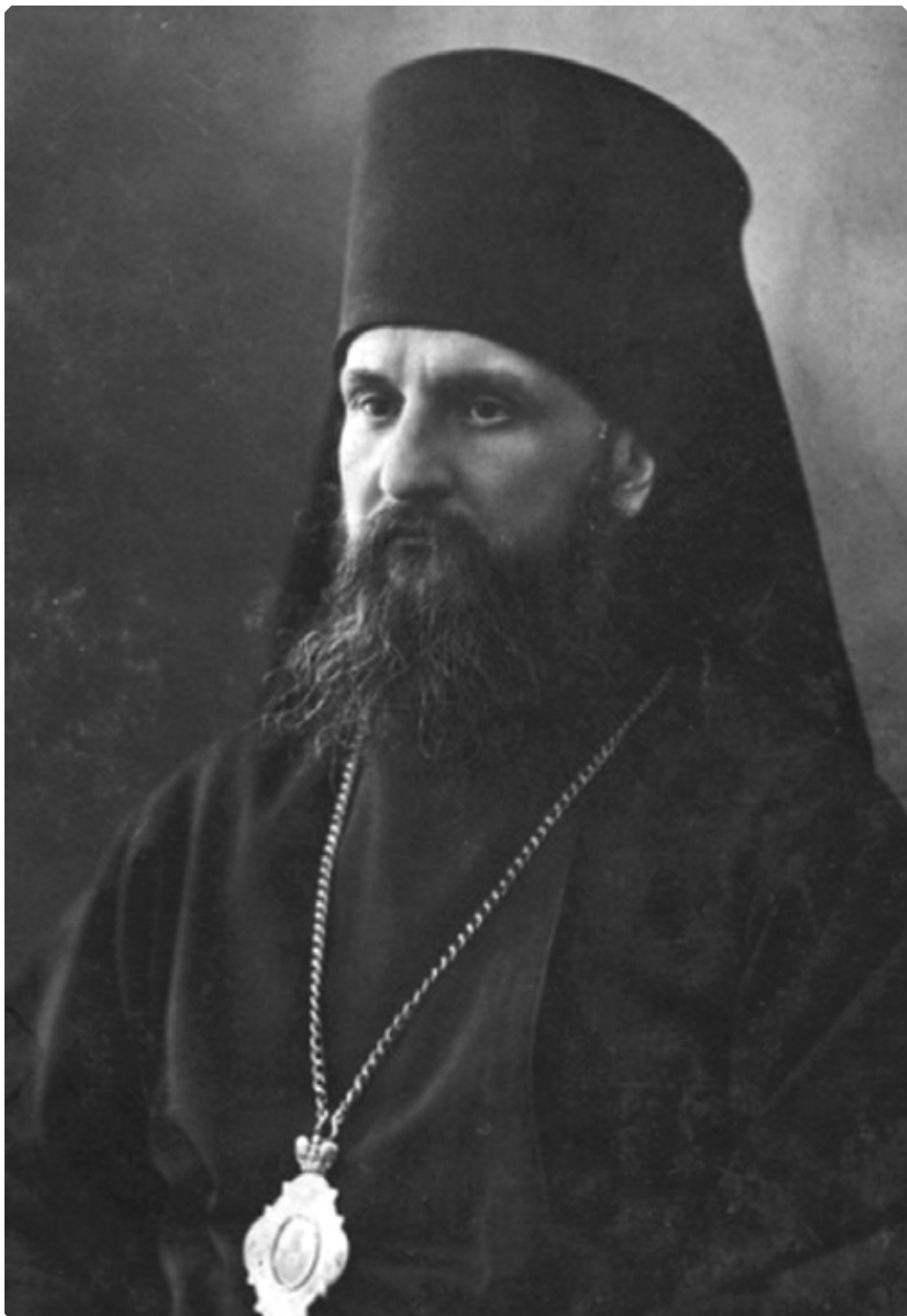
Преосвященнейший Андрей (Ухтомский), епископ Уфимский и Мензелинский

Несмотря на всю опасность сложившейся ситуации, отец Петр Гаврилов продолжал нести священнический крест. Уже при безбожной власти, оставаясь со вверенной ему паствой,