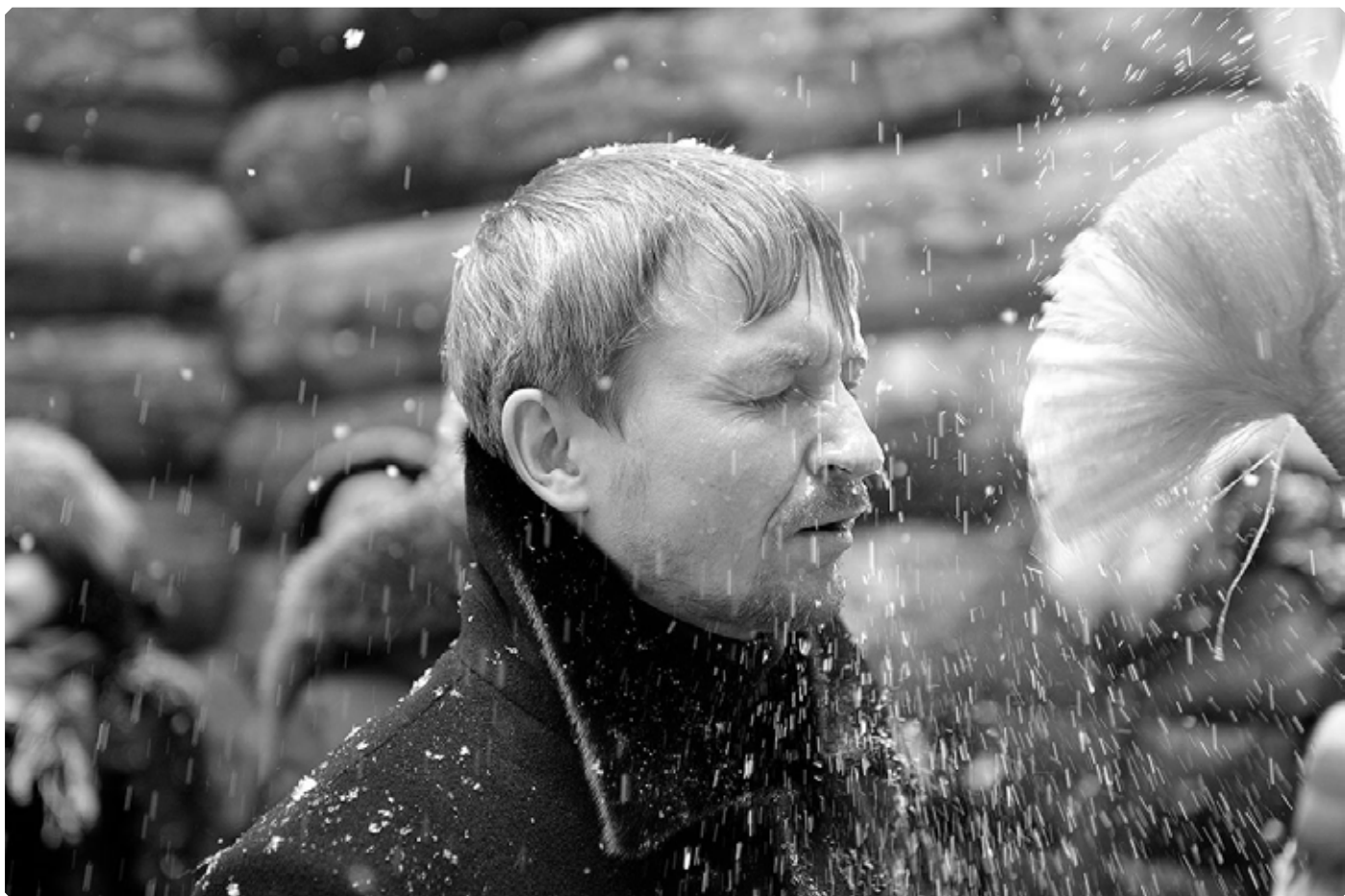
Окропление. Молебен в строящемся Сретенском храме. 2015 год