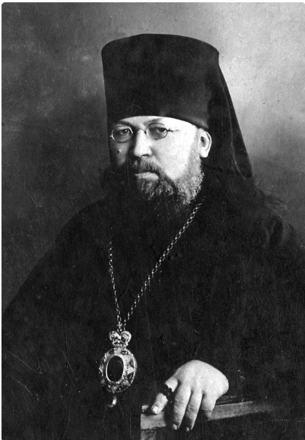
Преосвященнейший Анатолий (Каменский), епископ Томский и Алтайский

Рогов, бывший зауряд-прапорщик, участник Русско-японской, Первой мировой и Гражданской войн, уроженец Барнаульского уезда, пользовался большим авторитетом среди местных крестьян, что позволяло ему успешно партизанить с весны 1919 года. Хорошее знание местности позволяло ему уходить от многочисленных карательных