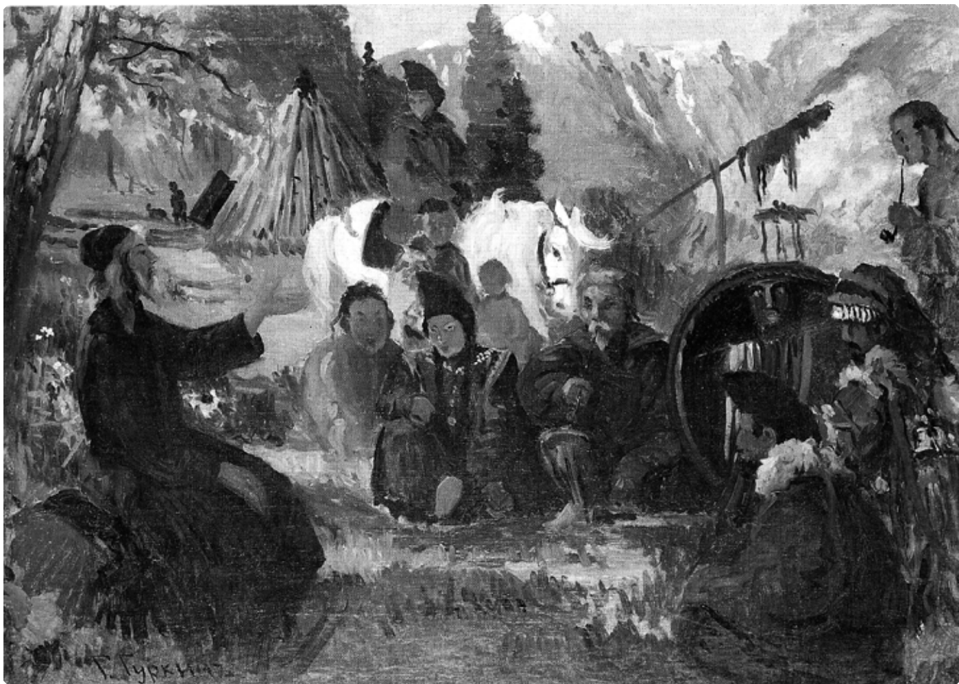
«Проповедь миссионера». Григорий Чорос-Гуркин. 1907 г. Национальный музей им. А.В. Анохина. г. Горно-Алтайск

Часовня, о которой упоминается в записках, была освящена в честь святителя Николая Чудотворца и относилась к Свято-Никольскому храму