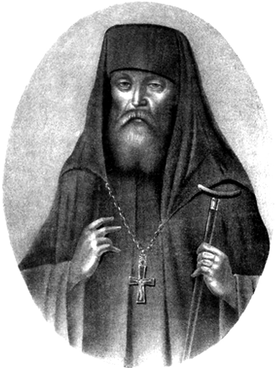
Портрет архимандрита Макария (Глухарёва). Литография. Около 1846 г. Копия. МАДМ

Кроме Новиковского редута они посетили деревню Ненинскую – современное село Ненинка, приходская жизнь которого нашла отражение на страницах июльского номера нашего журнала. 21 февраля миссионеры прибыли в Сайдып, где их встретили как дорогих гостей. По просьбе жителей форпоста солтонский священник Симеон благословил отцу Макарию служить на сайдыпском приходе. Обустройство на новом месте облегчалось тем, что указом Святейшего Синода основателю миссии были предоставлены широкие полномочия. Барнаульскому духовному правлению предписывалось, «чтобы местные священно- и церковнослужители, где будет находиться отец архимандрит Макарий, позволяли ему в своих церквах богослужение, когда он сего пожелает сам, а притом оказывали ему всевозможное пособие во всех его нуждах и исполняли беспрекословно законные его требования».