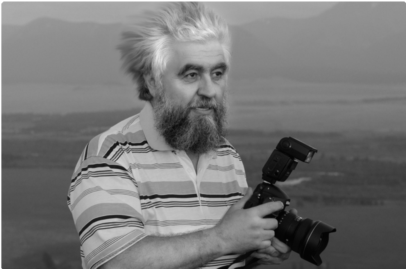
Фотография – многолетняя и пламенная любовь Владимира Черкасова.

– Скорее это увлечение, обратившееся в мое ремесло, не утратившее с течением времени изначальной увлеченности и ставшее для меня делом всей жизни.