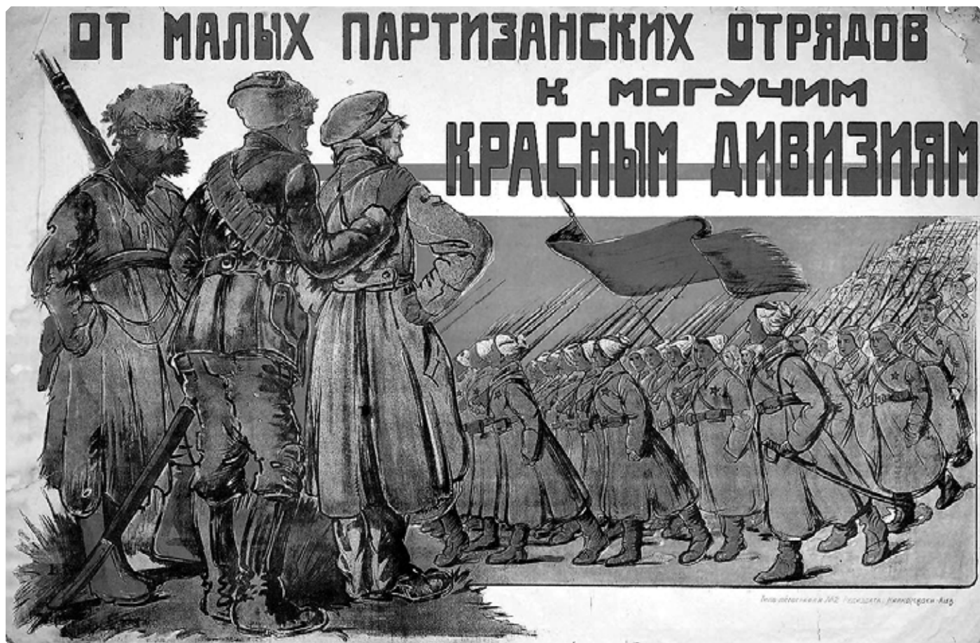
Плакат «От малых партизанских отрядов к могучим Красным дивизиям». Художник Борис Ефимов. Редиздат Наркомвоена. 1919 г.