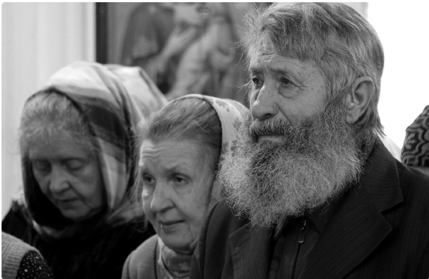
На праздничное богослужение в Сретенский храм поспешили и стар,..