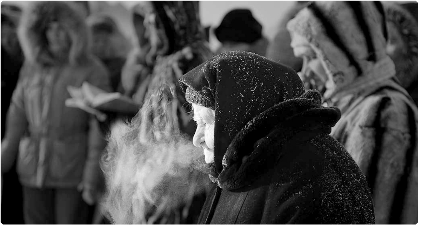
Минус сорок. Крещение Господне. 2011 год