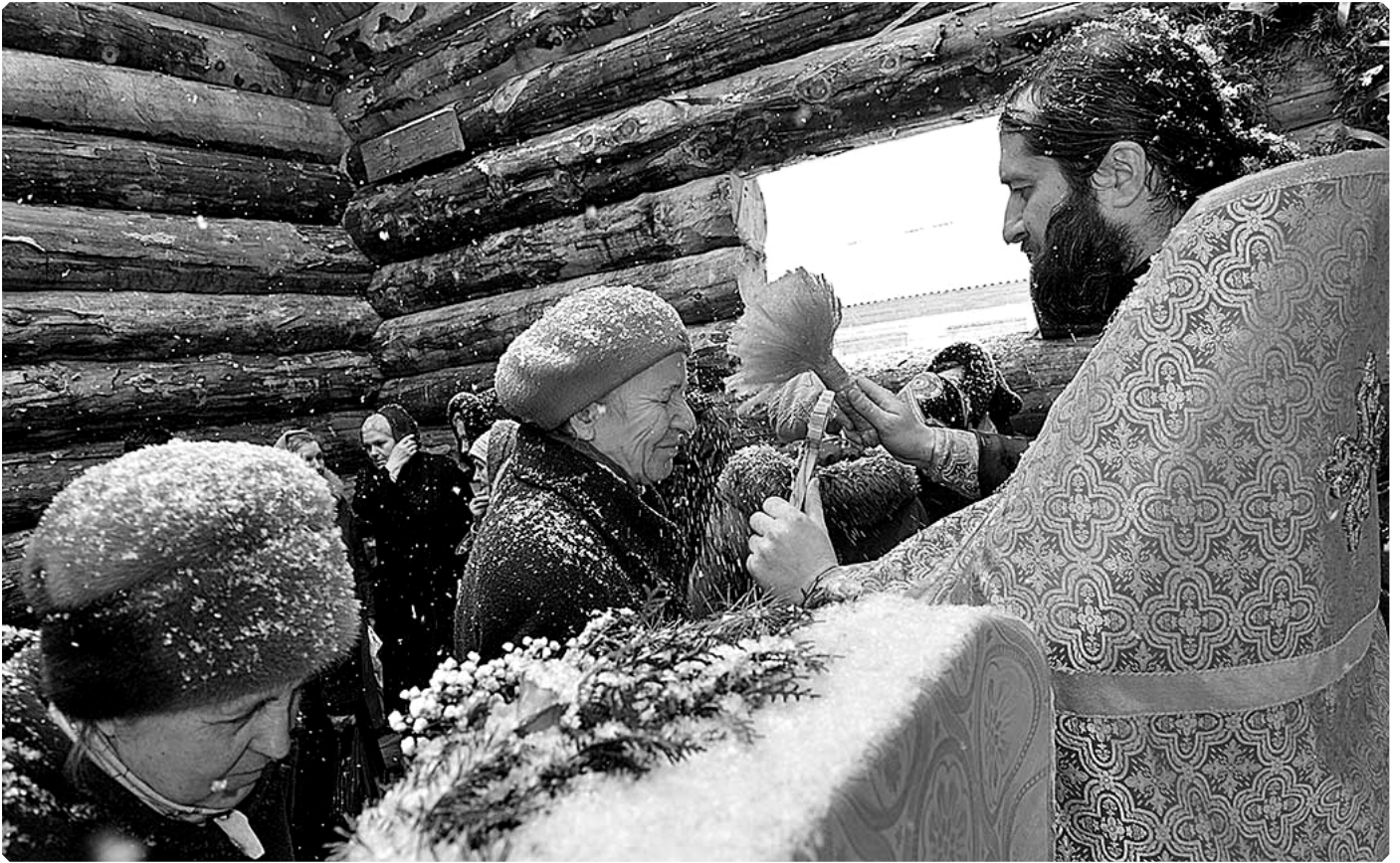
Молебен в строящемся Сретенском храме. 2015 год

– Кто вместе с Вами стоял у его истоков, кто вдохновлял Вас и помогал Вам? Кем были Ваши учителя?