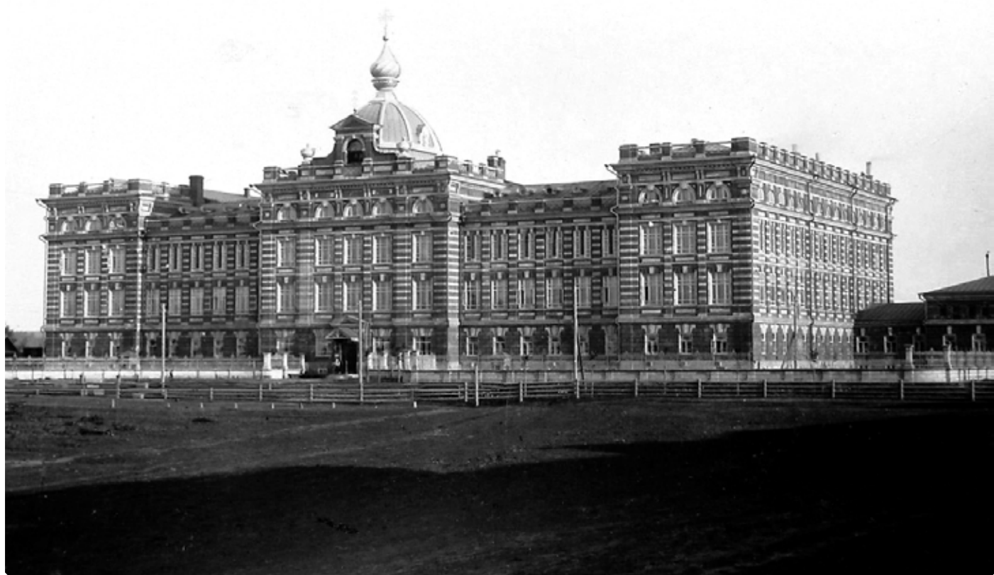
Здание Елабужского Стахеевского епархиального женского училища. г. Елабуга. Начало XX в.