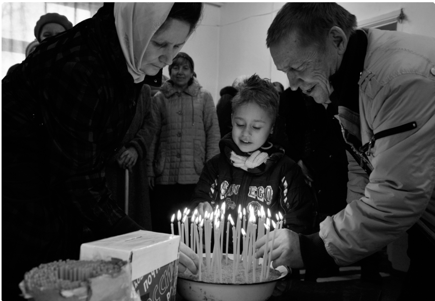
В Сретенском храме. 2014 год