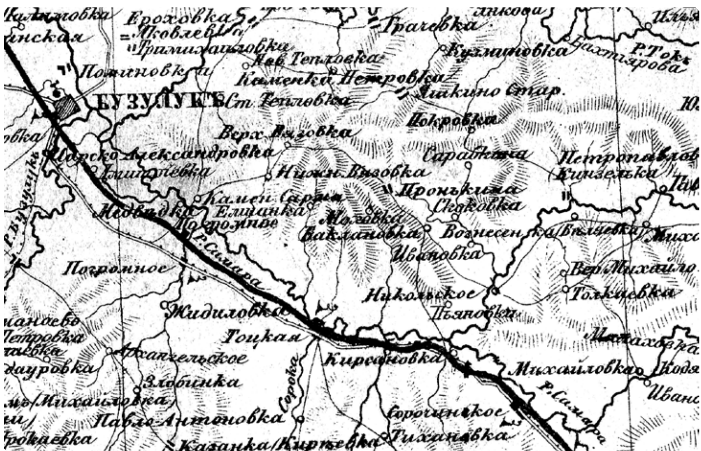
Вырезка карты Самарской губернии 1900 года. В правой части вырезки – село Толкаевка Бузулукского уезда Самарской губернии, родина предков В.М. Шукшина. Село стояло на реке Малый Уран, правом притоке реки Самары